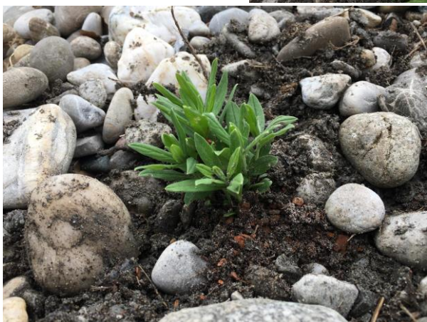
Die Bilder sind von meiner angepflanzten Wildblumenwiese in meinem Dorf. Andrina Zünd