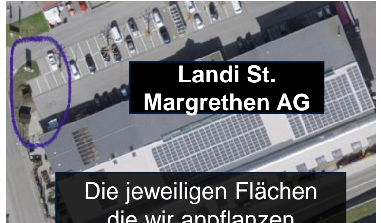
Landi St. Margrethen AG

Die jeweiligen Flächen die wir anpflanzen könnten -> die umkreisten Flächen